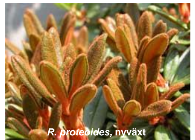
R. proteoides, nyväxt